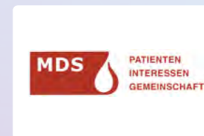
MDS Patienten Interessen Gemeinschaft